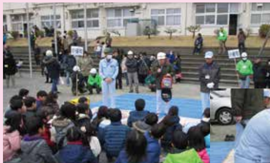
AEDの取り扱いについての説明

今回も当社は、心肺蘇生法とAEDの取り扱いについての訓練を担当しました。心肺蘇生を初めて体験する子供達に対し、胸の中央を押すなど、基本に基づき時間を掛けて指導をしました。今後も様々な防災訓練に協力していきたいと思っております。