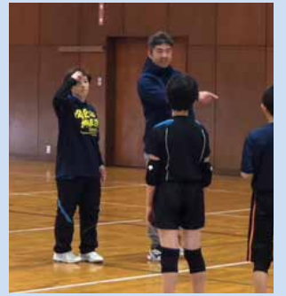
指導中の西脇夫妻