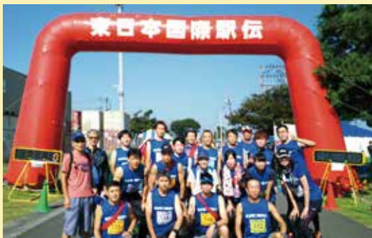
第27回東日本国際駅伝にて