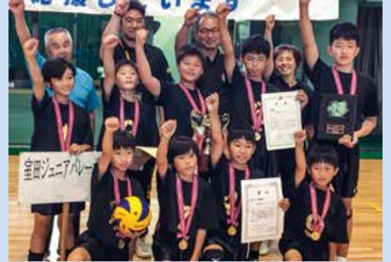
2017年 全国大会出場にて